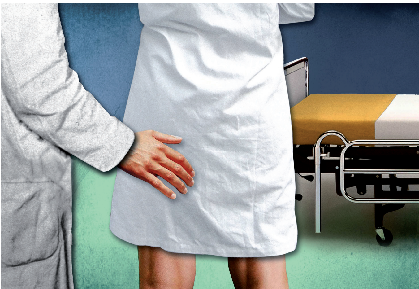
beeld: Het Wonderlab