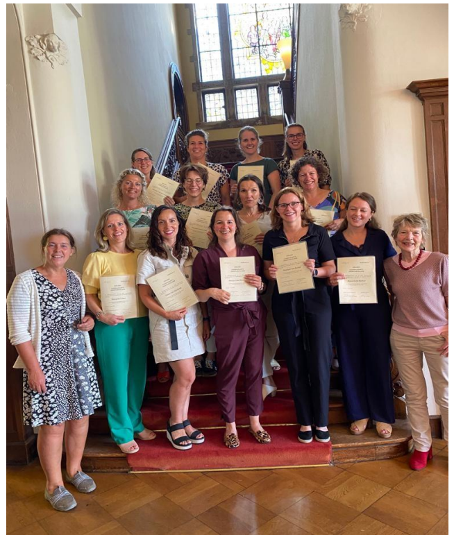
Diploma-uitreiking 7e groep.

De kaderhuisartsen zijn voor consultatie en advies de deskundigen voor huisartsen regionaal en landelijk en vervullen een belangrijke rol in opleiding en nascholing in de UMC-s en de regionale nascholingsorganisaties. Momenteel zijn er 71 opgeleide kaderhuisartsen urogynaecologie verspreid over het land (CHBB). Deze maand, september 2022, start de 8-ste groep